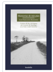
MEMORIAS DE MIS PIES REDONDO, LUIS