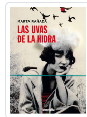
UVAS DE LA HIDRA, LAS RABADA, MARTA