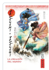
CREACION DEL MUNDO AA.VV.