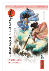
CREACION DEL MUNDO AA.VV.