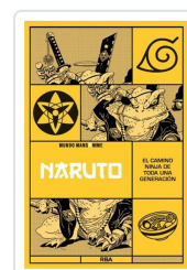
NARUTO. EL CAMINO NINJA DE TODA UNA GENERACION AA.VV.