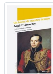
UN HEROE DE NUESTRO TIEMPO LERMONTOV, MIJAIL