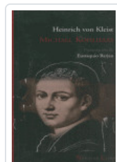
MICHAEL KOHLHAAS VON KLEIST, HEINRICH