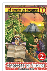
TU DECIDES, 3 CAZADORES TESORO BABIANO, IVAN