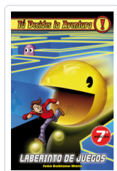
TU DECIDES, 1 LABERINTO JUEGOS BABIANO, IVAN