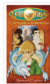
** LEO TITAN Y LA CUARTA DIMENSION CAPLAN, SAMUEL