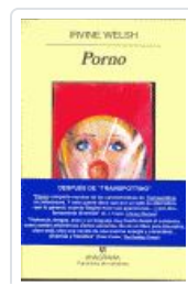
PORNO. WELSH, IRVINE