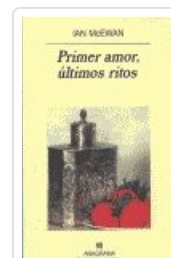
PRIMER AMOR, ÚLTIMOS RITOS