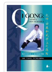
QIGONG SALUD Y ARTES MARCIALES YANG, JWING-MING