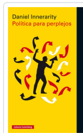
POLITICA PARA PERPLEJOS INNERARITY, DANIEL