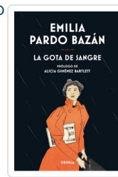
GOTA DE SANGRE, LA PARDO BAZAN, EMILIA