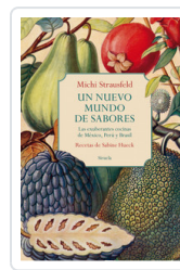
UN NUEVO MUNDO DE SABORES. EXUBERANTES COCINAS MEXICO, PERU STRAUSFELD, MICH/HUECK, SABINE