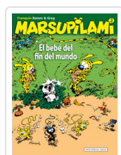
MARSUPILAMI, 2 BEBE FIN FRANQUIN, ANDRE