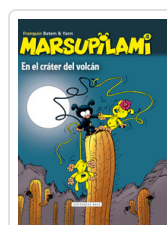
MARSUPILAMI, 4 EN EL CRATER VOLCAN FRANQUIN, ANDRE