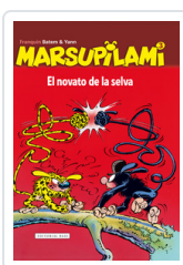
MARSUPILAMI, 3 NOVATO DE LA SELVA FRANQUIN, ANDRE