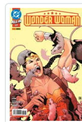
WONDER WOMAN, 3 AA.VV.