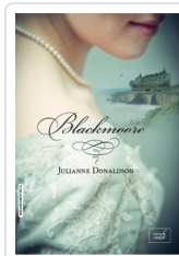
BLACKMOORE DONALDSON, JULIANNE