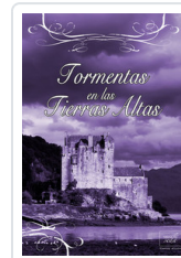
TORMENTAS EN LAS TIERRAS ALTAS COURTENAY, CRISTINA