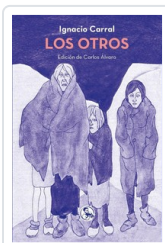
OTROS, LOS CARRAL, IGNACIO