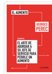
AUMENTO / ARTE DE ABORDAR PEREC, GEORGES