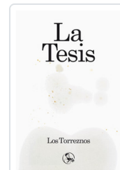
TESIS, LA LOS TORREZNOS