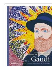
ASI ES... GAUDI CLAYPOOL/ CHRISTOFOROU