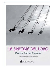
SINFONIA DEL LOBO, LA POPUESCU, MARIUS