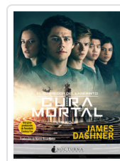
CORREDOR LABERINTO, 3 CURA MORTAL DASHNER, JAMES