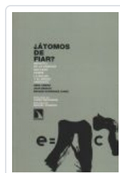
ATOMOS DE FIAR BENACH, JOAN