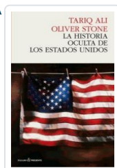
HISTORIA OCULTA DE ESTADOS UNIDOS ALI, TARIQ / STONE, O.