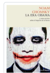
ERA OBAMA, LA CHOMSKY, NOAM