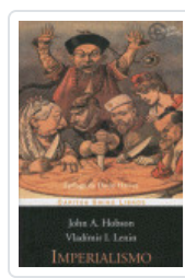
IMPERIALISMO HOBSON, JOHN