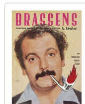
BRASSENS LA LIBERTAD SFAR, JOANN