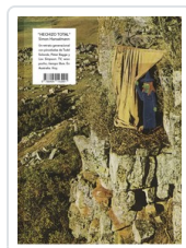
** HECHIZO TOTAL HANSELMANN, SIMON