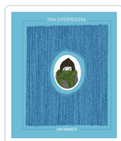
TINA SUPERFRIOLERA YAMAMOTO, LANI