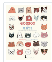
GOSSOS I GATS SOTA LA LUPA DE CIENTIFICOS FISCHETTI, ANTONIO