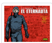
ETERNAUTA, EL OESTERHELD, H.G.