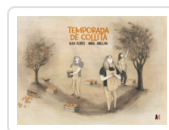
TEMPORADA DE COLLITA (CATALAN) FLORES/ ABELLAN