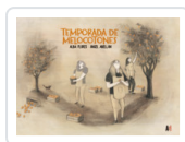
TEMPORADA DE MELOCOTONES FLORES/ ABELLAN