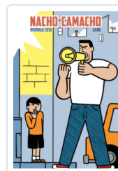
NACHO CAMACHO COTA/ JANO