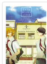
EN LA MISMA CLASE, 1 NAKAMURA, ASUMIKO