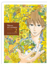
NIEVE EN VERANO, 2 KAWACHI, HARUKA