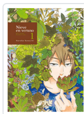
NIEVE EN VERANO, 1 KAWACHI, HARUKA