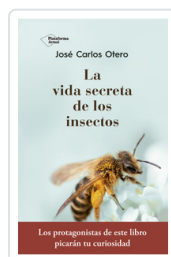
VIDA SECRETA DE LOS INSECTOS, LA OTERO, JOSE CARLOS