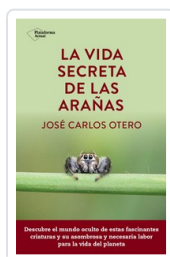
VIDA SECRETA DE LAS ARÁÑAS, LA OTERO, JOSE CARLOS