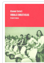
VIDAS ERRATICAS CELATI, GIANNI