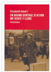
EN GRAN CENTRAL STATION SMART, ELIZABETH