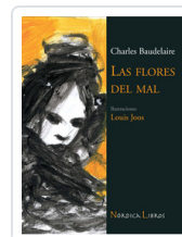
FLORES DEL MAL - ILUSTRADO- BAUDELAIRE, CHARLES