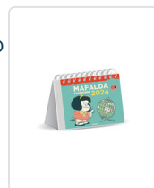
MAFALDA 2024 CALENDARIO ESCRITORIO TURQUESA QUINO