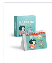
MAFALDA 2024 CALENDARIO ESCRITORIO TURQUESA + CAJA QUINO