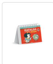
MAFALDA 2024 CALENDARIO ESCRITORIO ROJO QUINO