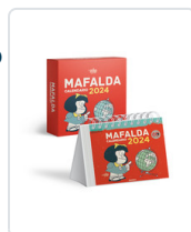
MAFALDA 2024 CALENDARIO ESCRITORIO ROJO + CAJA QUINO