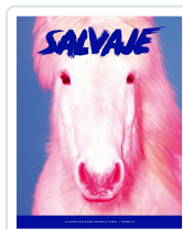
REV. SALVAJE,27 AA.VV.