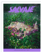
REV. SALVAJE,26 AA.VV.