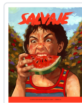
REV. SALVAJE,25 AA.VV.