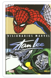
VISIONARIOS MARVEL: STAN LEE