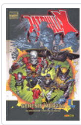
PATRULLA-X: GENESIS MORTAL (MD) BRUBAKER