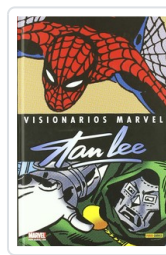
VISIONARIOS MARVEL: STAN LEE