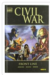
CIVIL WAR: FRONT LINE (MD) JENKINS