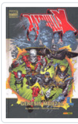
PATRULLA-X: GENESIS MORTAL (MD) BRUBAKER