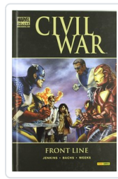
CIVIL WAR: FRONT LINE (MD) JENKINS