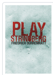
PLAY STRINDBERG DÜRRENMATT, FRIEDRICH