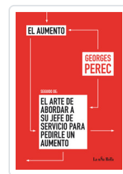
AUMENTO / ARTE DE ABORDAR PEREC, GEORGES