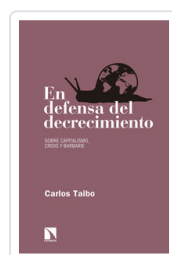
EN DEFENSA DEL DECRECIMIENTO TAIBO, CARLOS