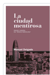
CIUDAD MENTIROSA, LA DELGADO, MANUEL