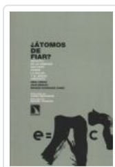
ATOMOS DE FIAR BENACH, JOAN