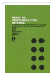
NUESTRA CONTAMINACIÓN INTERNA PORTA, MIQUEL