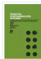
NUESTRA CONTAMINACION INTERNA PORTA, MIQUEL