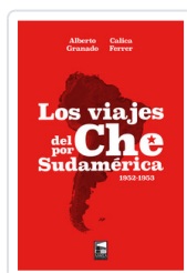
VIAJES DEL CHE POR SUDAMERICA, LOS FERRER, CALICA