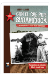
CON EL CHE POR SUDAMERICA GRANADO, ALBERTO