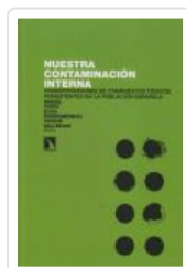
NUESTRA CONTAMINACION INTERNA PORTA, MIQUEL