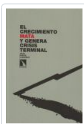
EL CRECIMIENTO MATA Y GENERA CRISIS TERMINAL GARCIA, JULIO