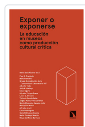
EXPONER O EXPONERSE SOLA, BELEN