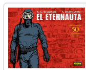
ETERNAUTA, EL OESTERHELD, H.G.