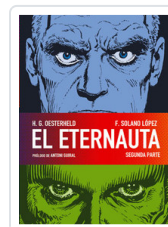
ETERNAUTA, 2 OESTERHELD, H.G.