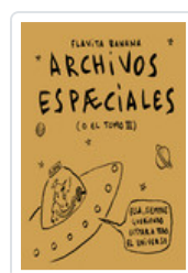
ARCHIVOS ESPACIALES BANANA, FLAVITA