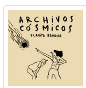
ARCHIVOS COSMICOS BANANA, FLAVITA