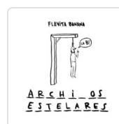
ARCHIVOS ESTELARES BANANA, FLAVITA