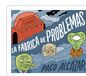
FABRICA DE PROBLEMAS, LA ALCAZAR, PACO