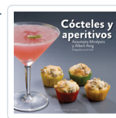
COCTELES Y APERITIVOS MIRALPEIX, ASSUMPTA