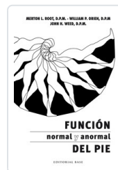
FUNCION NORMAL Y ANORMAL DEL PIE MERTON, L.