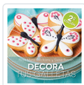
DECORA TUS GALLETAS ESCRIBANO, ROSA Mª