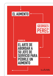
AUMENTO / ARTE DE ABORDAR PEREC, GEORGES