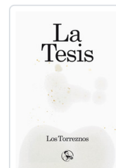
TESIS, LA LOS TORREZNOS