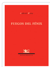
FUEGOS DE FENIX WEISZ, GABRIEL