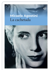
CACHETADA, LA AGOSTINI, MICAELA