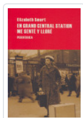
EN GRAN CENTRAL STATION SMART, ELIZABETH