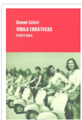
VIDAS ERRATICAS CELATI, GIANNI