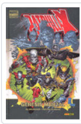
PATRULLA-X: GENESIS MORTAL (MD) BRUBAKER