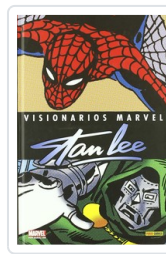
VISIONARIOS MARVEL: STAN LEE