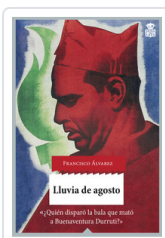
LLUVIA DE AGOSTO ALVAREZ, FRANCISCO