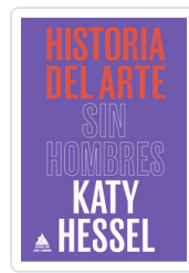
HISTORIA DEL ARTE SIN HOMBRES HESEL, KATY