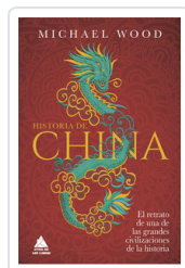
HISTORIA DE CHINA. RETRATO UNA GRANDES CIVILIZACIONES HISTO WOOD, MICHAEL