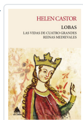
HELEN CASTOR LOBAS LAS VIDAS DE CUATRO GRANDES REINAS MEDIEVALES CASTOR, HELEN