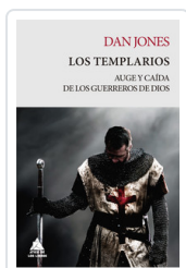
DAN JONES LOS TEMPLARIOS AUGE Y CAIDA DE LOS GUERREROS DE DIOS JONES, DAN