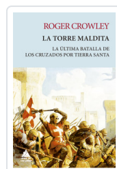
ROGER CROWLEY LA TORRE MALDITA LA ÚLTIMA BATALLA DE LOS CRUZADOS POR TIERRA SANTA CROWLEY, ROGER