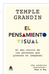
TEMPLE GRANDIN EL PENSAMIENTO VISUAL El don oculto de las personas que piensan en imágenes GRANDIN, TEMPLE