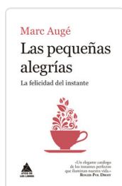
Marc Augé Las pequeñas alegrías La felicidad del instante AUGE, MARC