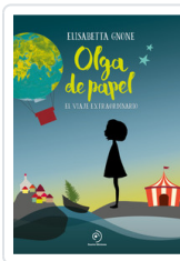
OLGA DE PAPEL GNONE, ELISABETTA