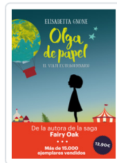
OLGA DE PAPEL - OFERTA- GNONE, ELISABETTA