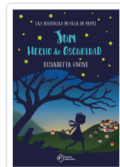
JUM HECHO DE OSCURIDAD GNONE, ELISABETTA