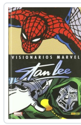
VISIONARIOS MARVEL: STAN LEE