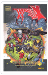
PATRULLA-X: GENESIS MORTAL (MD) BRUBAKER