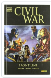
CIVIL WAR: FRONT LINE (MD) JENKINS