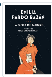
GOTA DE SANGRE, LA PARDO BAZAN, EMILIA