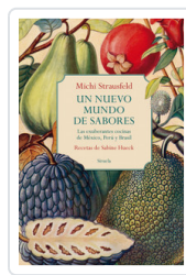
UN NUEVO MUNDO DE SABORES. EXUBERANTES COCINAS MEXICO, PERU STRAUSFELD, MICH/HUECK, SABINE