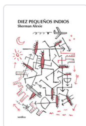
DIEZ PEQUEÑOS INDIOS SHERMAN, ALEXIE