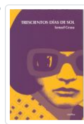
TRESCIENTOS DÍAS DE SOL GRASA, ISMAEL